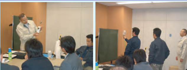
▲各種機器類の取扱い方法及び塗布施工指導(契約者限定、所要時間:約3H)