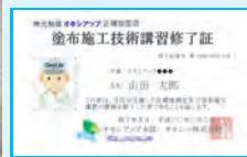
▲施工技術講習修了証

【説明会情報】 日時: 随時(要予約)10:00~ (説明会:午前、技術指導:午後) 場所: オキシ(株) 駅前営業所 滋賀県草津市大目1丁目1-1 Lty932 5F ※JR草津駅(東口)直結