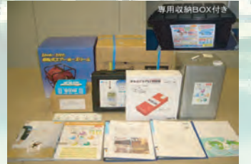
▲初期機材一式(DXタイプ)