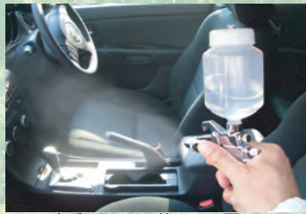
▲自動車への施工風景