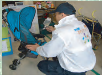
▲製品への加工風景